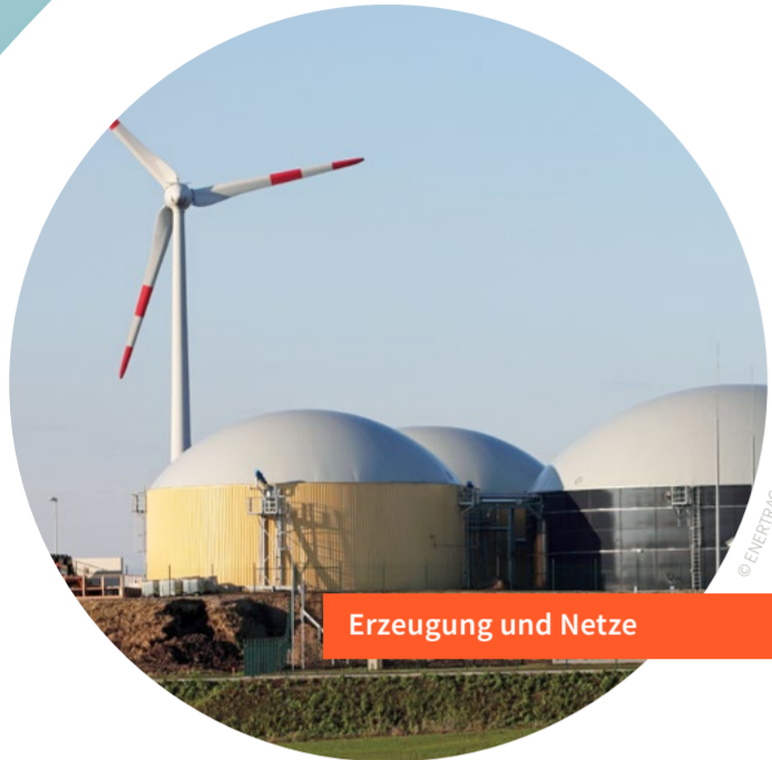
Erzeugung und Netze