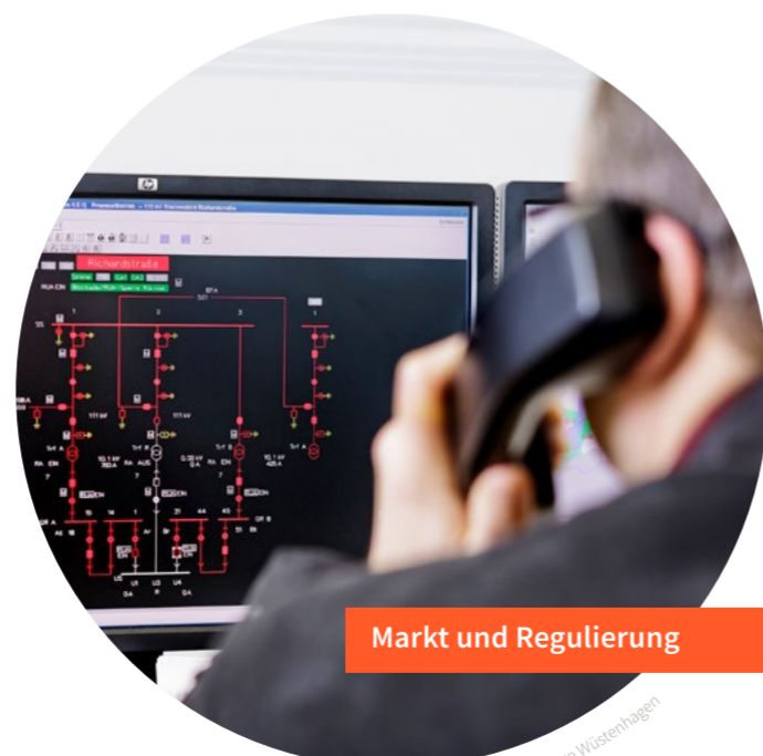
Markt und Regulierung

Die Energiewende ist mehr als eine „Stromwende“. Im Wärme- und Mobilitätssektor bieten sich enorme Potenziale für Flexibilisierung und Dekarbonisierung. Die engere Verknüpfung dieser Sektoren mit dem Elektrizitätssystem kann helfen, die Balance zwischen Erzeugung und Nutzung von elektrischer Energie zu halten. Im Bild der Balkenwaage (siehe Abbildung) symbolisiert die Sektorkopplung gewissermaßen Verschiebewichte zum Austarieren. Die Idee der Sektorkopplung ist nicht neu, jedoch steht sie vor mindestens ebenso großen regulatorischen und wirtschaftlichen Herausforderungen wie vor technischen Entwicklungsbedarfen. WindNODE zeigt für Power-to-Heat (PTH) und Power-to-Cool (PtC) ein breites Spektrum an Musterlösungen zwischen kleinen, dezentralen Anlagen und der 100-Megawatt-Klasse. Daneben werden in WindNODE verschiedene Ansätze für die Einbindung von Elektrofahrzeugflotten in das System erprobt.