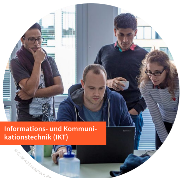
Informations- und Kommunikationstechnik (IKT)

Den Strombedarf gezielt zeitlich zu verschieben, ist eine Möglichkeit, auf die schwankende Einspeisung der Erneuerbaren zu reagieren. Wir beschreiben systematisch das Vorgehen zum Auffinden von Flexibilitäten bei verschiedenen mustertypischen Nutzern und betrachten dabei Lastverschiebung ebenso wie Stromspeicher und Sektorkopplung. Unsere Partner aus Industrie, Gewerbe und Wohnquartieren identifizieren Flexibilitätpotenziale und testen deren netz-, system- und marktdienlichen Einsatz.